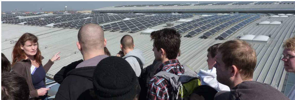
Während der IHM besichtigte der Schornsteinfegernachwuchs ein Solardach.

Zylinder ragen aus der Besuchermenge, die sich durch die Young Generation - den Messeteil für den Nachwuchs im Handwerk - drängt. Zwischen Bäckern, Zimmerern und weiteren Handwerksberufen präsentieren hier die Schornsteinfeger ihren Beruf. In der Halle rund um das Thema Energieeffizienz befragen die Berufsschüler Experten. Sie erhalten neue Einblicke in Anlagentechnik und Energiesparmaßnahmen. Die Aussteller beraten die jungen Schornsteinfeger und stellen sich ihren kritischen Fragen zu Biomasseheizungen, Pelletkessel und Wärmepumpen. Besonders interessant ist für die Auszubildenden auch die Vielfalt der ausgestellten Einzelfeuerstätten. Insgesamt haben die Berufsschüler an diesem Messetag viele bleibende Eindrücke rund um ihr Handwerk gewonnen.